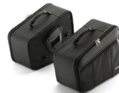
KIT VALIGIE SEMIRIGIDE