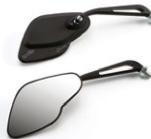
SPECCHIO IN ALLUMINIO