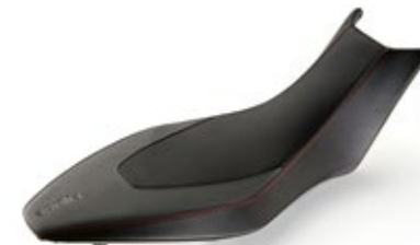
SELLA COMFORT IN GEL

SCOPRI TUTTA LA GAMMA DEGLI ACCESSORI APRILIA SUL SITO WWW.APRILIA.COM