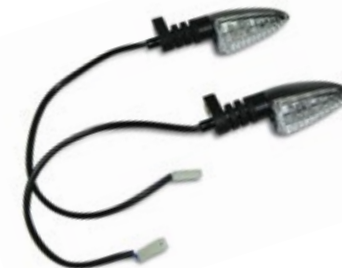
KIT FRECCHE A LED