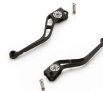
KIT LEVA RACING