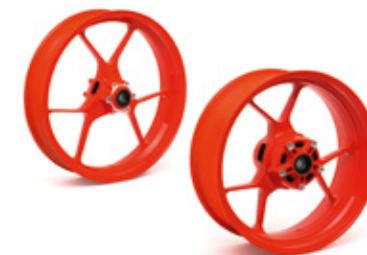
CERCHI ROSSI IN ALLUMINIO