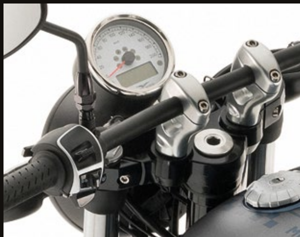
MANUBRIO DRAGBAR NERO OPACO