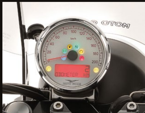
STRUMENTO ANALOGICO CON DISPLAY LCD