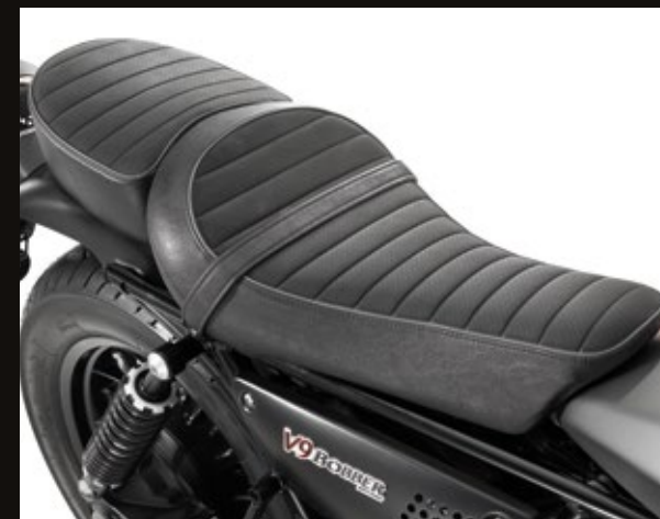
ACCOGLIENTE SELLA BIPOSTO CON PORZIONE PASSEGGERO RIMOVIBILE