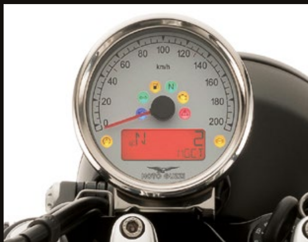
STRUMENTO ANALOGICO CON DISPLAY LCD