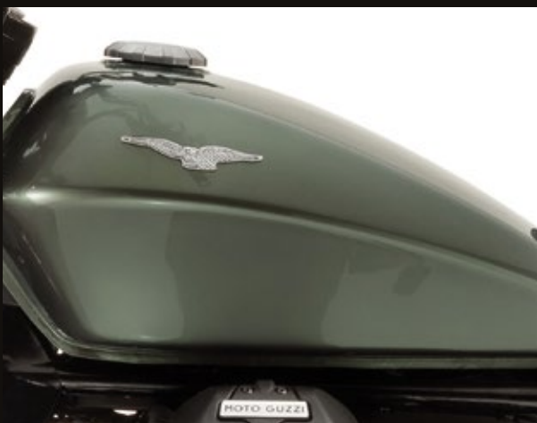
SERBATOIO IN ACCIAIO CON AQUILA IN RILIEVO