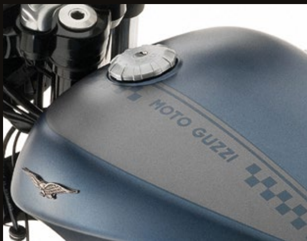
SERBATOIO IN ACCIAIO A FINITURA OPACA