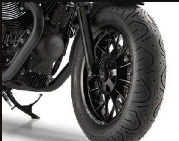
PNEUMATICO ANTERIORE 130/90