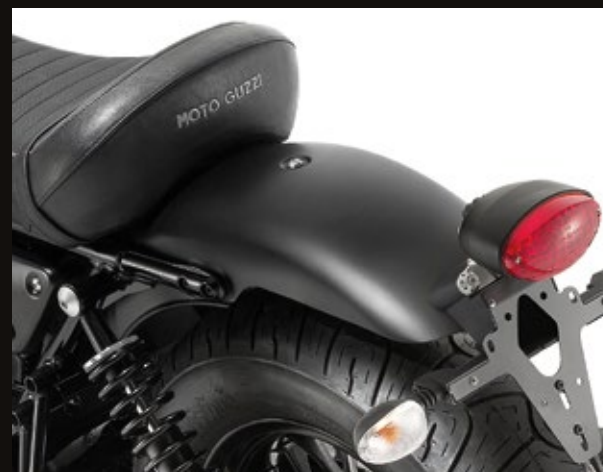
PARAFANGO POSTERIORE CORTO