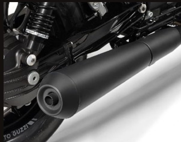
SCARICO NERO SATINATO