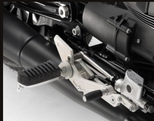
PEDANE E SUPPORTI IN ALLUMINIO