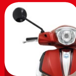
SPECCHIETTI RETROVISORI NERI