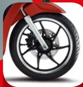
CERCHI DIAMANTATI NERI