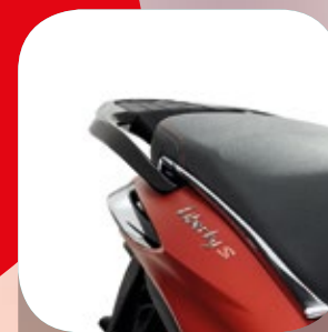
PORTAPACCHI POSTERIORE NERO