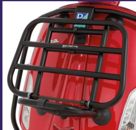
PORTAPACCHI ANTERIORE NERO