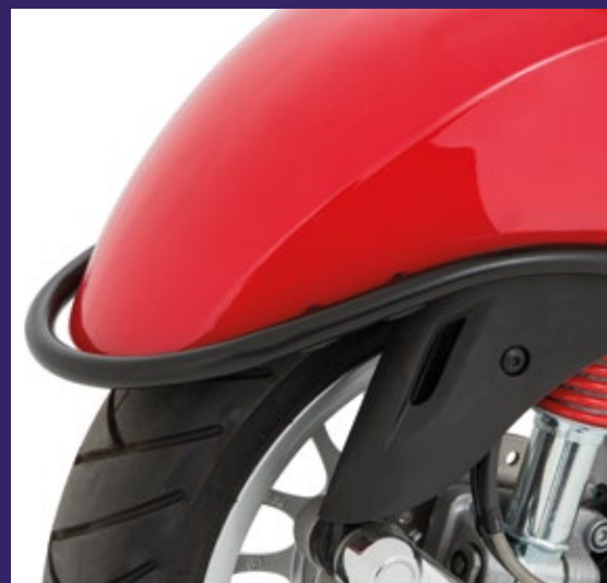
PROTEZIONE PARAFANGO NERA